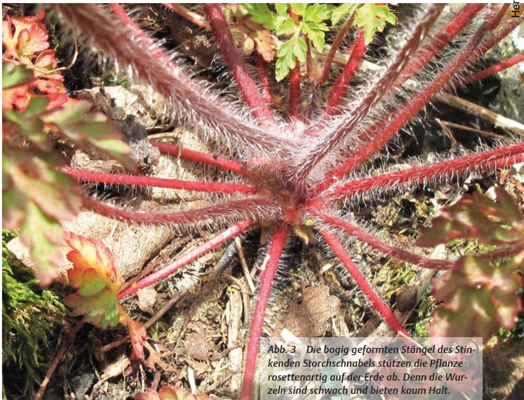
Abb. 3 Die bogig geformten Stängel des Stinkenden Storchschnabels stützen die Pflanze rosettenartig auf der Erde ab. Denn die Wurzeln sind schwach und bieten kaum Halt.