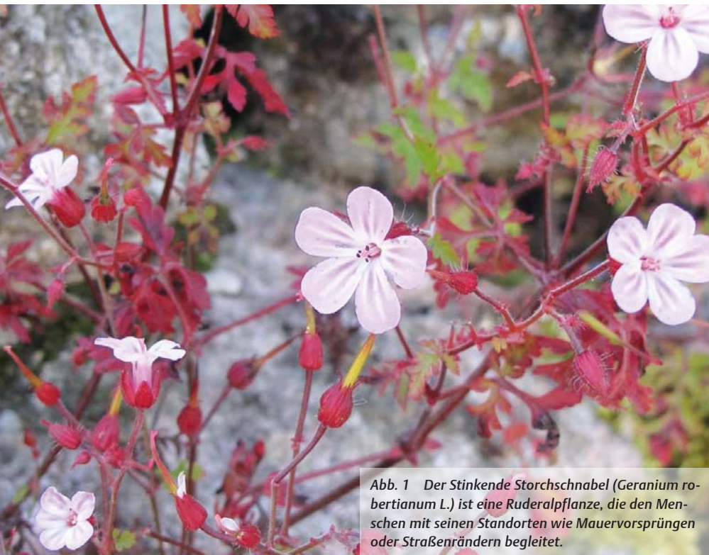
Abb. 1 Der Stinkende Storchschnabel ( Geranium robertianum L.) ist eine Ruderalpflanze, die den Menschen mit seinen Standorten wie Mauervorsprüngen oder Straßenrändern begleitet.

In der Heilkunde des Altertums werden zwar einige Geraniumarten erwähnt, aber sehr wahrscheinlich handelt es sich nicht um den Stinkenden Storchschnabel. Hingegen wird er von den Heilkundigen des späteren Mittelalters sehr gerühmt. Die Botaniker und Ärzte Pietro Andrea Matthiolus und Hieronymus Bock führ-