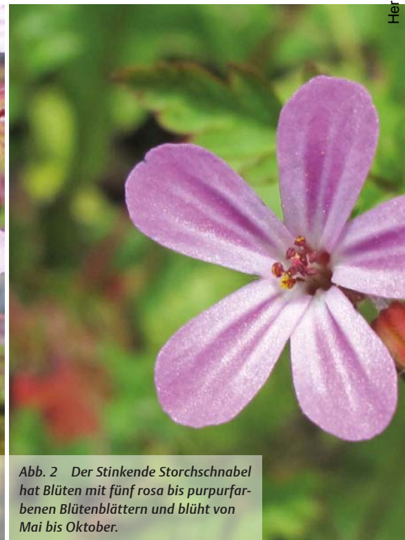
Abb. 2 Der Stinkende Storchschnabel hat Blüten mit fünf rosa bis purpurfarbenen Blütenblättern und blüht von Mai bis Oktober.