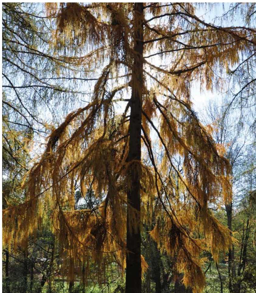
Abb. 2 Die Lärche ist der Baum der Frische. Die Volksheilkunde setzt das Lärchenterpentin äußerlich ein, beispielsweise gegen Furunkel.

Die Wirkung der Lärchenknospen ist bis heute noch nicht ausreichend erforscht. Es ist jedoch ziemlich wahrscheinlich, dass sie wie die Knospenpräparate anderer Nadelbäume bei Gelenksbeschwerden und Erkrankungen der Atemwege wirken.