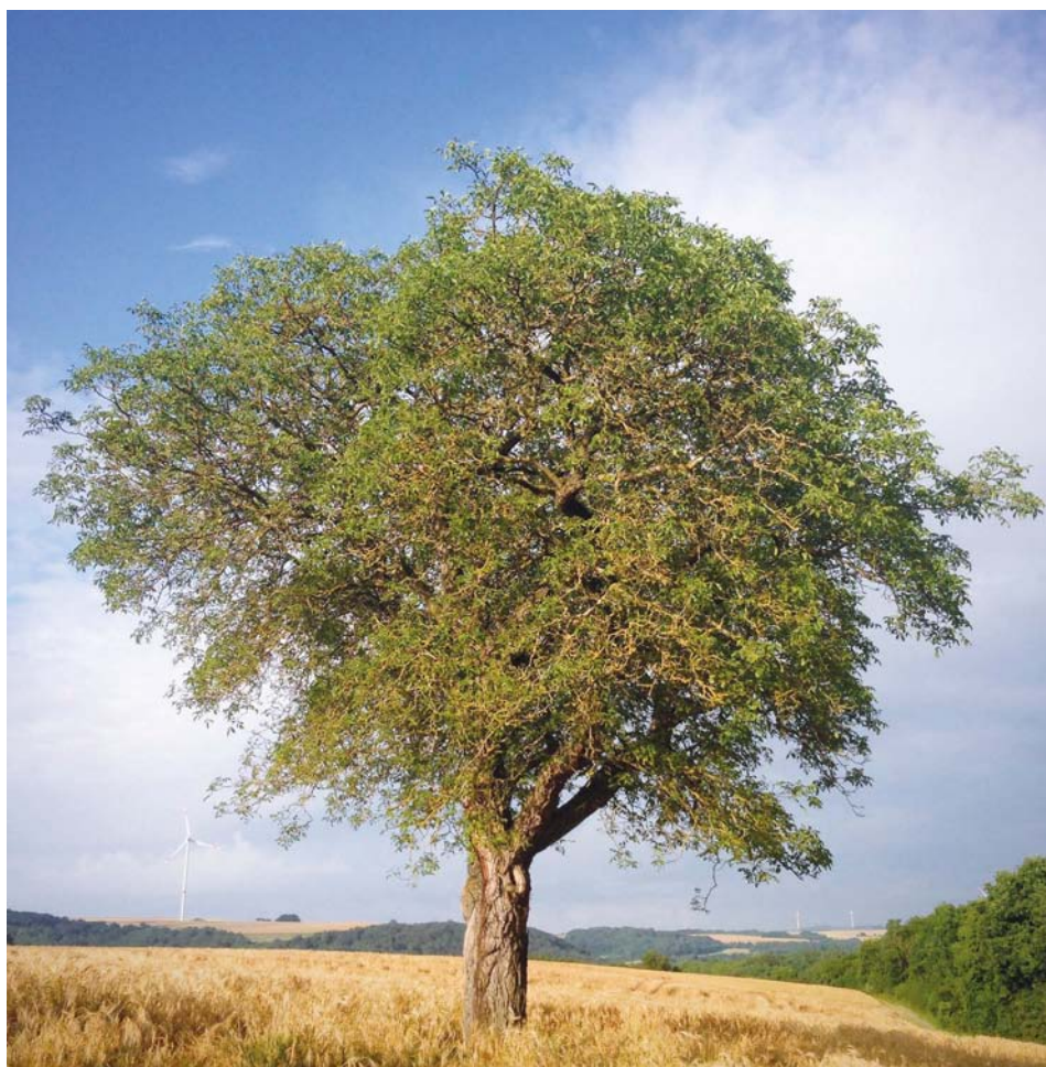
Abb. 4 Der Walnussbaum ist ein Kraftbaum. Als Bachblüte Walnut hilft er Menschen mit fehlendem Mut.

Nicht umsonst spricht man davon, „eine harte Nuss zu knacken“, wenn es darum geht, ein schwieriges Unterfangen zu einem guten Ende zu bringen. Man könnte fast meinen, dass es sich bei dieser Nuss um die Walnuss handelt. Denn Walnut hilft, aus erstarrten Konventionen und Rollenbildern auszubrechen, sich auf den Weg zu machen, um neue und vor allem eigene Ideen zu verfolgen. Walnut verleiht den notwendigen Mut, den es für